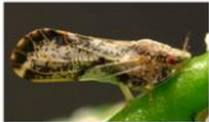
Asian citrus psyllid (ACP) Diaphorina citri