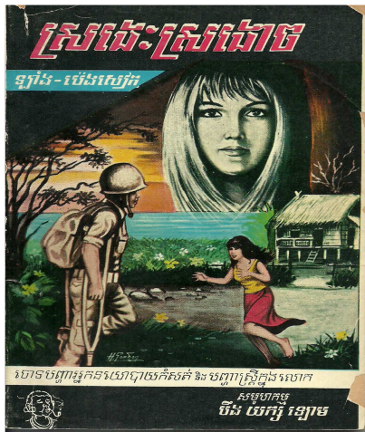
ស្រងេះស្រងើច, ក្របក្រៅមុខ