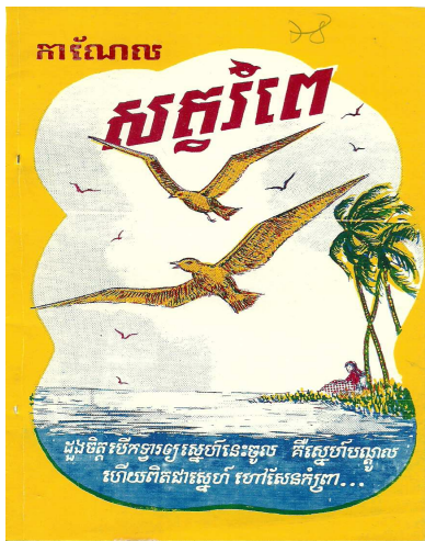
សត្វរំពេក្របក្រៅ