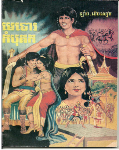
មេចោរកំបុត ក, ក្របក្រៅមុខ

តាមប្រភពអ៊ិនតែណែន Satya Composer សន្និដ្ឋានថា លោកឡាំងប៉េងសៀក តែងនិពន្ធ ប្រលោមលោកខ្លះៗទៀតដោយ ឲ្យនាមប៉ាកាថា «កាណែល» ៖