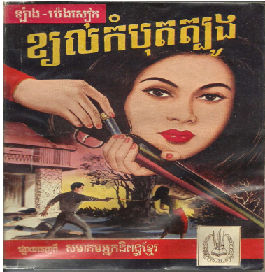
ខ្យល់កំបុតត្បូង, ក្របក្រៅមុខ