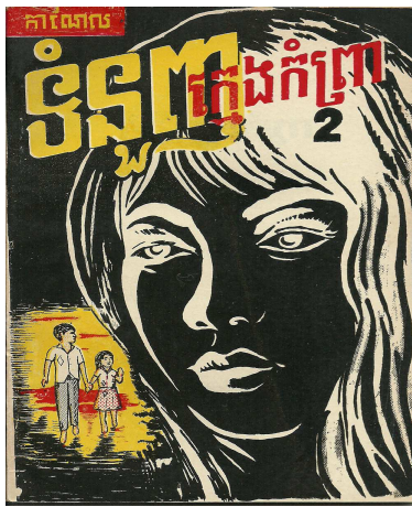
ទំនួញក្មេងកំព្រា ក្របក្រៅ