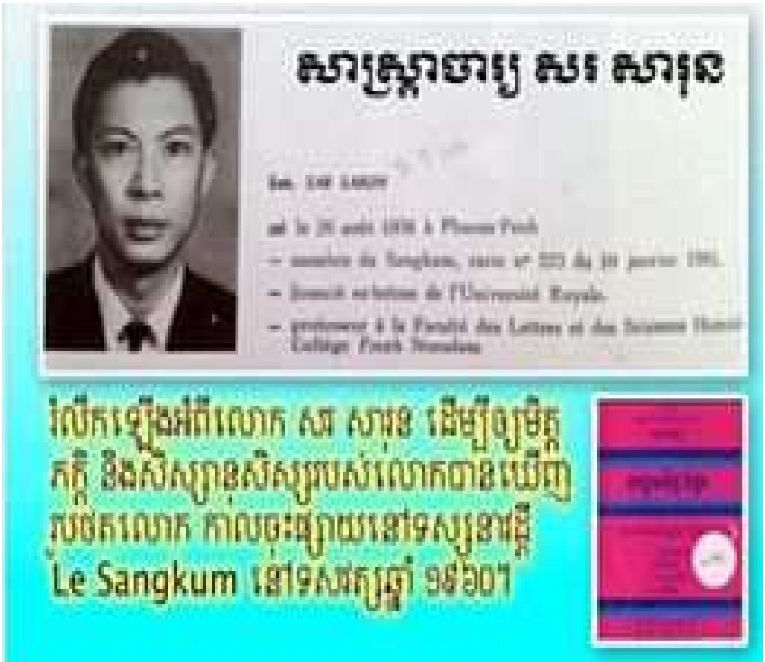
រូបថតនេះលោក អ៊ុចភិរម្យ បានស្រង់ចេញពីទស្សនាវដ្តី Le Sangkum (សូមអរគុណលោកដោយបានចែករំលែករូបថតនេះ)។