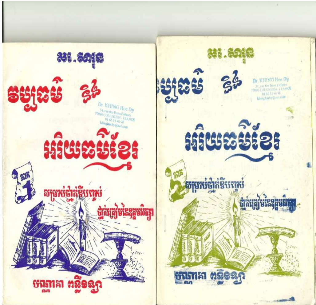
វប្បធម៌និងអរិយធម៌ ភាគទី១ + និង ភាគទី២, ភ្នំពេញ, បណ្ណាគារពន្លឺវិទ្យា, ១៩៧០, ២២៦ទំព័រ។