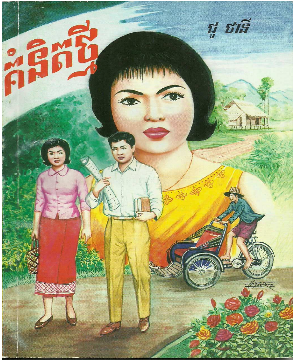
ផ្សាយដំបូងនៅឆ្នាំ១៩៦៦។