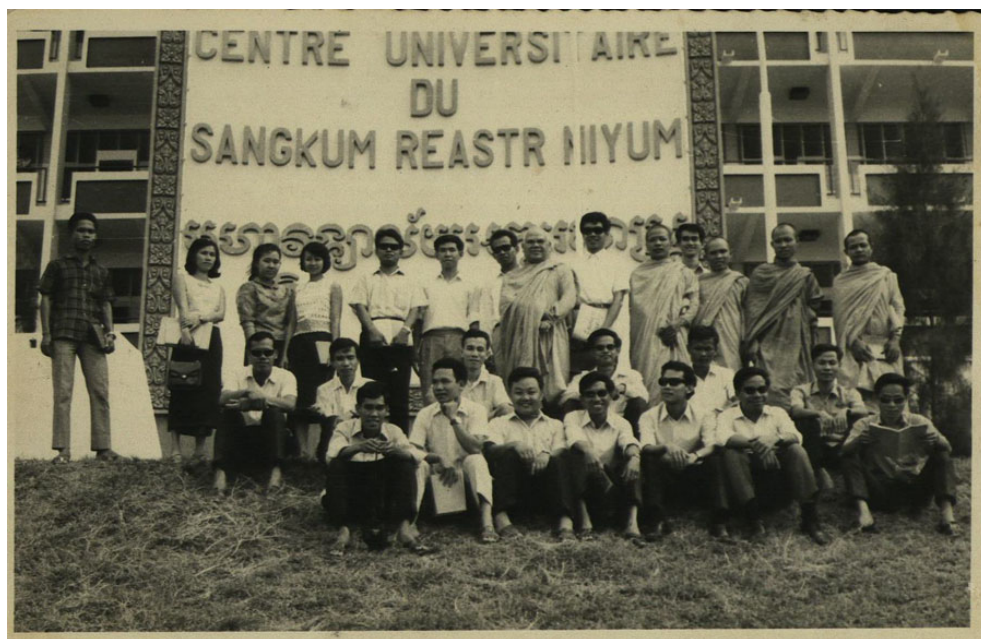
ព្រះមហាវិរិយបណ្ឌិតោប៉ាងខាត់ថតជាមួយនិស្សិតជំនាន់ឆ្នាំ ១៩៦៧