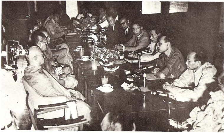
ព្រះមហាក្សត្រនៃប្រទេសកម្ពុជាបានចាត់រួមក្នុងការជំនុំនយោបាយជាមួយ គណៈរដ្ឋមន្ត្រីសាធារណរដ្ឋខ្មែរក្រោមអធិបតីភាពអ្នកអង្គម្ចាស់ស៊ីសុវត្ថិ សិរិមតៈ នាឆ្នាំ១៩៧០/៧១